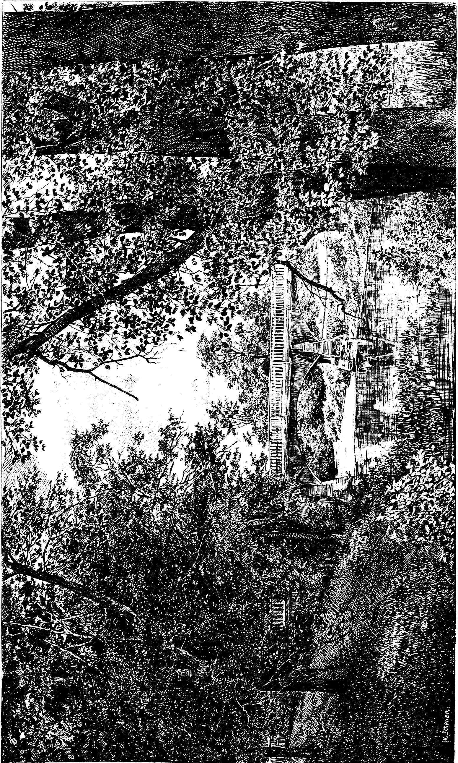
LA RIVIÈRE DE LA TORTUE, SUR LE CHEMIN DE FER Q. M. O. ET O.