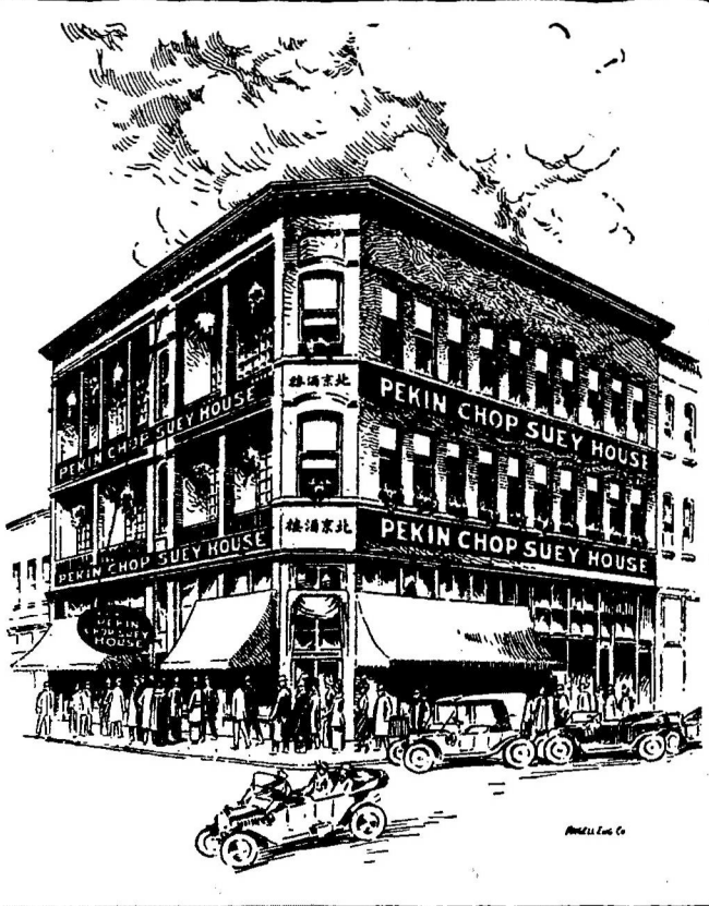
本樓在雲哥華埠打街夾卡路街角喊線失磨四三六七號