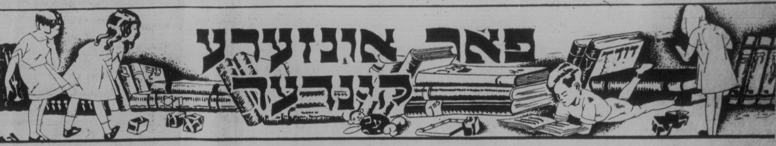
אנגעפירט פונם לערערראט פון דער י. ל. פרוי-שול