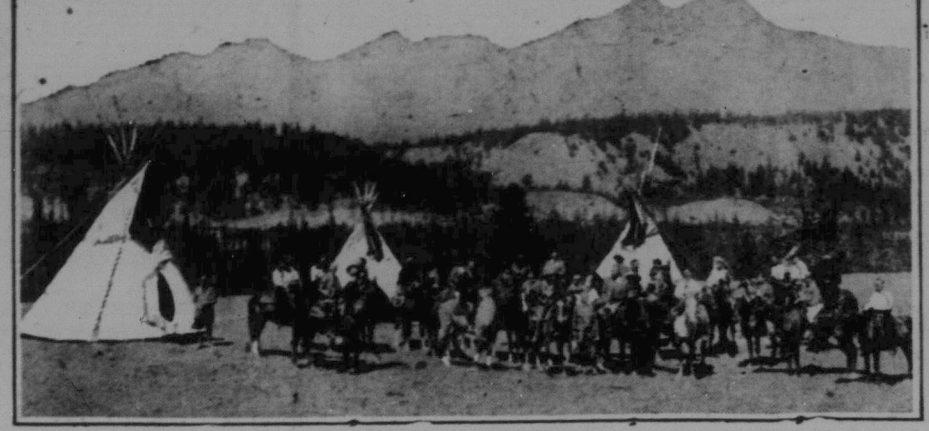
Da fältmarskalk Haig besökte Jasper National Park samt fick höra tal om organisationsmötet av Jasper skvadronen av Trail Riders of the Canadian Rockies...

läger utan och att förena sig med organisationen som en charter-medlem. Detta skedde och utom fältmarskalken anslöt även medlemmarna av hans uppriktade. I bilden syns earl Haig och hans maka i säll-