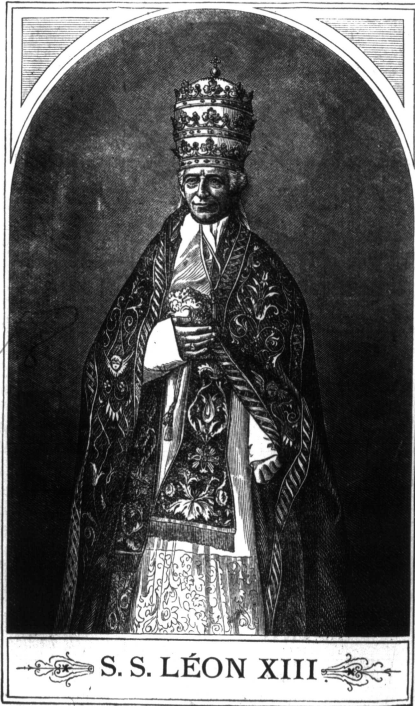
S. S. LÉON XIII