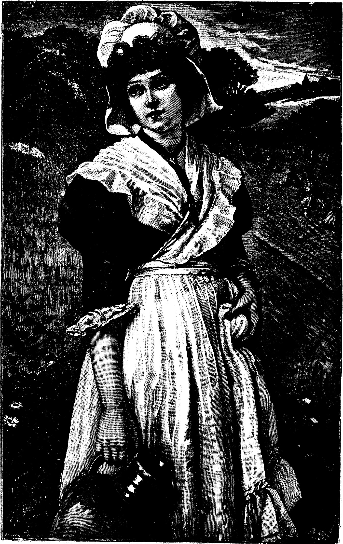
EVANGELINE — (Voir Entre-Nous)