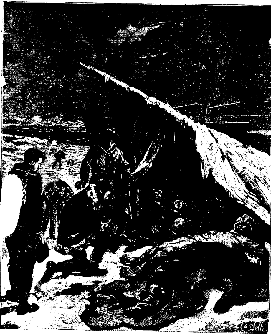
Le plus navrant spectacle s'offrit à leurs yeux.—Page 301, col. 3.

La tente était à demi renversée sur son unique montant, et l'on ne pouvait parvenir à en soulever la toile raidie par la glace ; il fallut la fendre à coups de couteau. Près de l'ouverture gisait, la tête pendante, une forme cadavérique ; sa mâchoire tombait, ses yeux ouverts étaient fixes et vitreux, les jambes restaient inertes ; à l'opposé était un pauvre être, vivant à coup sûr, mais sans mains ni pieds ; une cuiller était attachée au moignon de son bras droit. Deux autres individus, assis par terre, au milieu de la tente, venaient de décrocher une gourde de caoutchouc attachée au montant, et en versaient le contenu dans une tasse d'étain. En face, accroupi sur ses