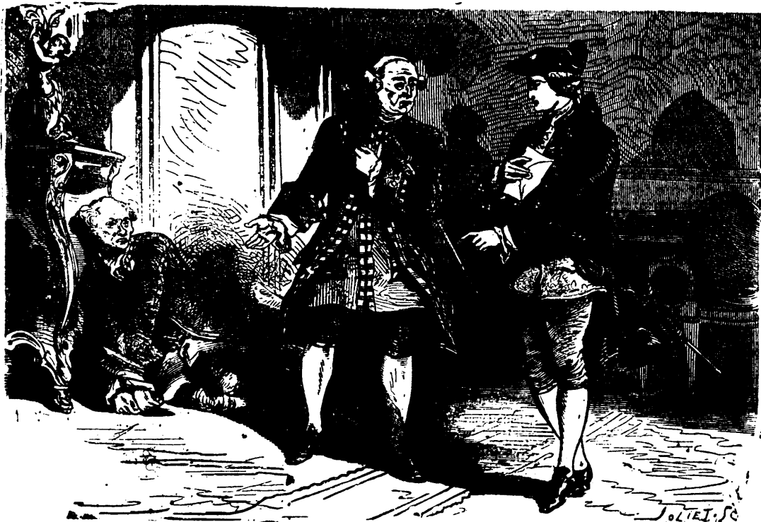
Voilà toute l'histoire, et monsieur le baron en sait maintenant aussi long que moi.—(Page 56, col 1).

—Je ne puis te parler ici, lui dit-il tout bas, je vais t'attendre dans la rue, à cent pas de la porte