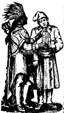
MARQUE DE COMMERCE.

Voulez-vous ne plus tousser? Faites usage de l' Elixir Resineux Pectoral , le grand remède du jour contre la TOUX, le RHUME et autres affections de la Gorge et des Poumons.