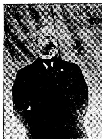
市長梯拿復本報函

市長梯拿復本報函 尊函不讀 不才蒙 民一致 市長深 貴報加 獎之忱 此復 市長梯