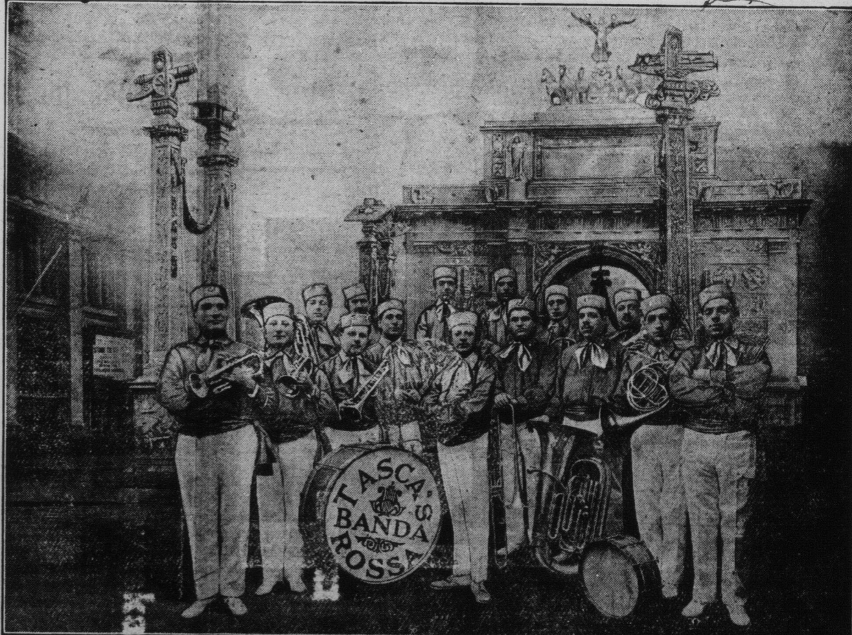
Tascas' famous Banda Rossa is here shown before the great Victory Arch on Fifth Avenue, New York city. This famous organization, which appears on the last day of the Community Chautauque, has distinguished itself by its fine patriotic work for the third, fourth and fifth Liberty loan campaigns. It is presenting a program of military and popular music especially arranged for this great victory tour.

Edmundston Chautauque, AOUT 7 à 11 Inclusive