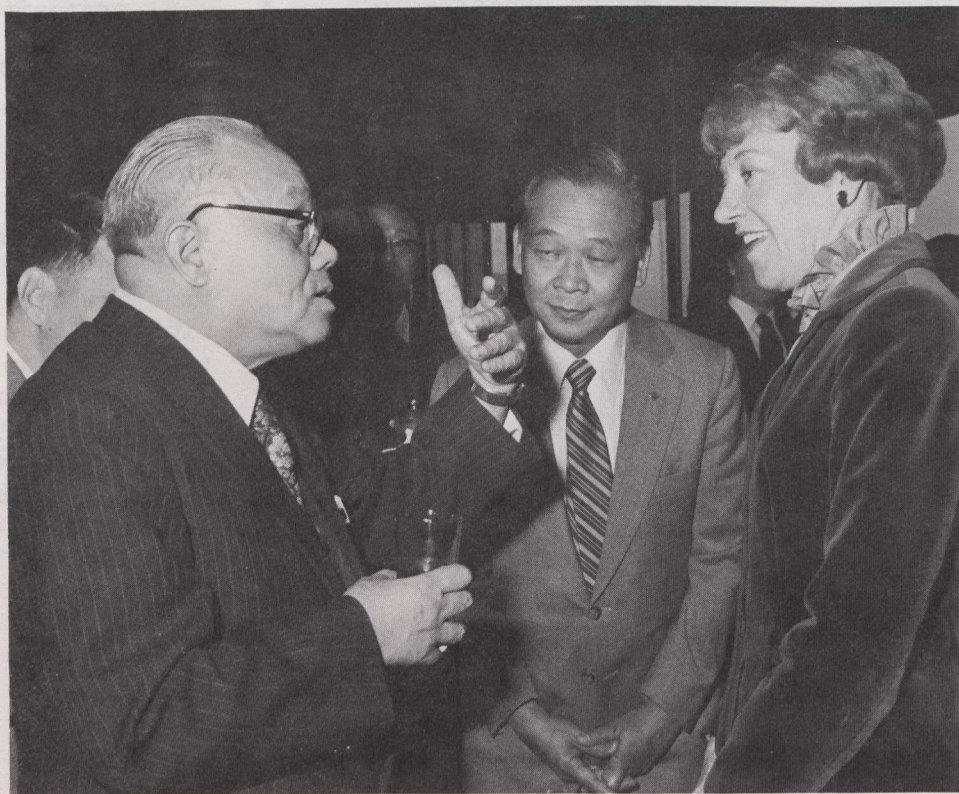
La Secretaria de Estado para Asuntos Exteriores, Flora MacDonald, con el Ministro de Comercio Exterior Li Qiang (izquierda) durante el almuerzo en su honor. Ho Yu-Lin (centro), intérprete de la Secretaría de Estado, se encuentra a la expectativa.

En 1978 el comercio entre los dos países ascendió a $598 millones de dólares e incluía los $503 millones de dólares de exportación a China y los $95 millones de dólares de importaciones canadienses de China. Las exportaciones canadienses a China consistían principalmente en cereales y otras materias semiprocesadas.