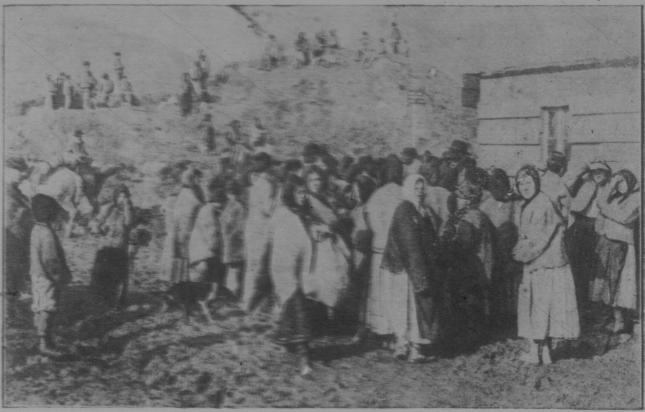
Frei und Selbsterziehung an die Soldaten des 149. Regiments.