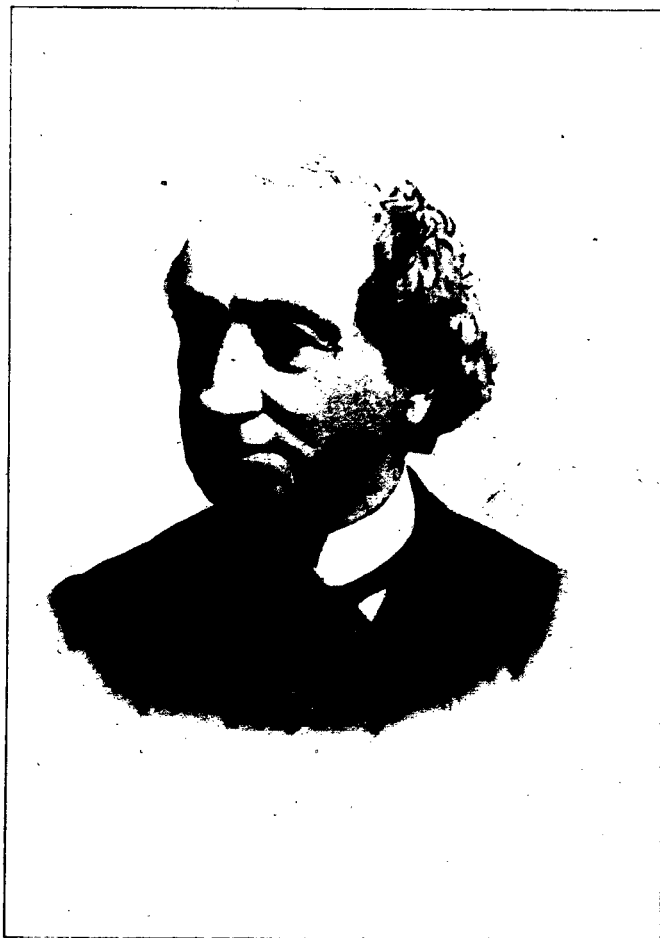
SIR JOHN A. MACDONALD