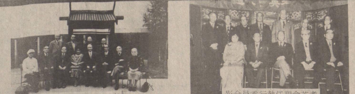
影合老元份部會英耆