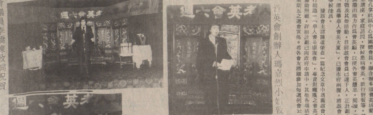
影合員委行執任現會英耆