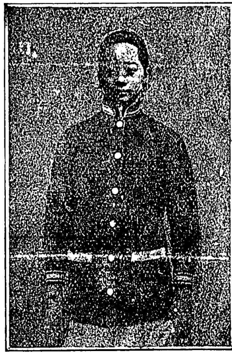
唐 女 庄

司公造織田心 W. Samtien CO 436 Columbia Ave Vancouver, B.C.