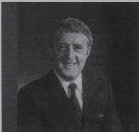
Il Primo Ministro Brian Mulroney

Brian Mulroney lascia il partito in buono stato ed il paese in via di ripresa. Il P.P.C. è il partito di governo ed ha la maggioranza al senato; dispone inoltre dei mezzi finanziari necessari per affrontare la battaglia elettorale in vista delle prossime votazioni, che si terranno probabilmente nell'autunno 1993. L'economia canadese è in piena ripresa, con uno dei tassi d'inflazione più bassi delle nazioni industrializzate. Secondo le previsioni dell'OECD, il Canada sarà il membro dell'OECD con il più alto tasso di crescita nel periodo 1993-94.