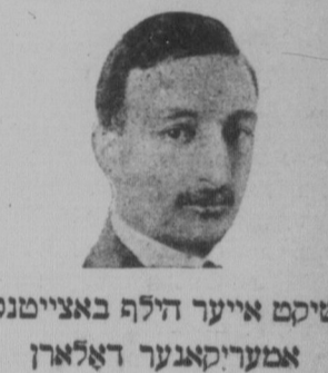
שיקס אייער היף באצייטנס אמעריקאנער דאלארן