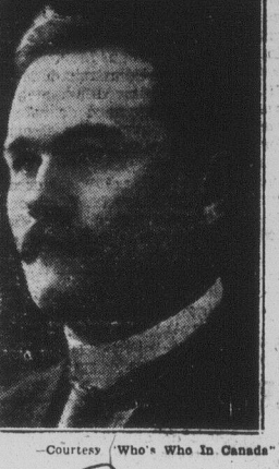
HON. CHARLES AVERY DUNNING, P.C.

This is the signature of a man who is by temperament deeply earnest and who has at the same time a dash of gaiety and charm which, although generally under restraint and consequently suggested rather than exhibited, make his an appealing personality.