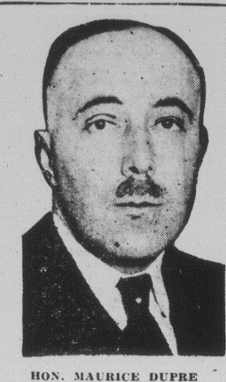
HON. MAURICE DUPRE Solicitor-General

After fifty-two years of devotion to the cause of Blake, Laurier and King, unbroken by even the threat of Conservative invasion, Quebec West in 1928 changed its colors and sent a young ex-Rhodes scholar to represent it in the 17th parliament of Canada.