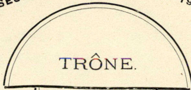
DIAGRAMME DE LA SALLE DU SÉNAT. 2 E SESSION. 9 E PARLEMENT. 1902.

Président: HON. LAWRENCE G. POWER, Halifax.