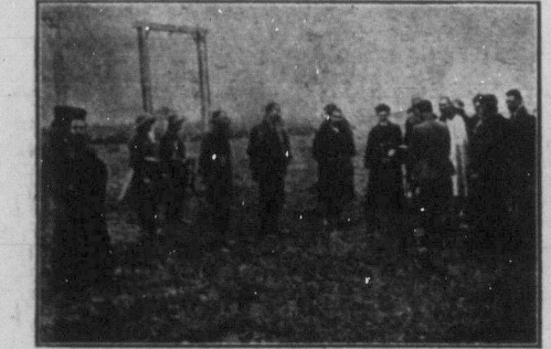
Засудженням болгарських комуністам читають смертний присуд.

Японія приступає до виконання програми своїх морських зброєнь. Мають бути вибудовані в прешу чергу 4 кружляки і 4 торпедовці. Обі держави над Тихим Океаном, себ-то Залуцянською Японія та випередки роблять морські зброєння.