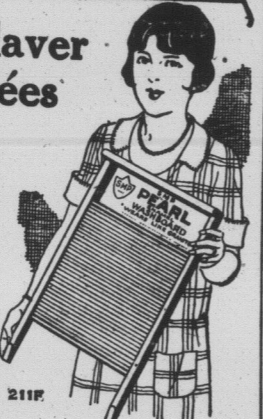
PLANCHE à LAVER émaillée SMP

ELLE est si forte que vous pourriez, sans l'endommager, vous tenir debout dessus. La surface de frottement est recouverte d'une épaisse couche d'émail Pearl SMP elle est; aussi douce que la vitre, mais contrairement à elle, elle ne peut se casser! Elle ne s'usure pas comme le zinc. A l'arrière, elle est munie d'un solide renfort de bois. Cette planche à laver durera bien des années — et rappelez-vous qu'elle est fabriquée par la maison SMP.