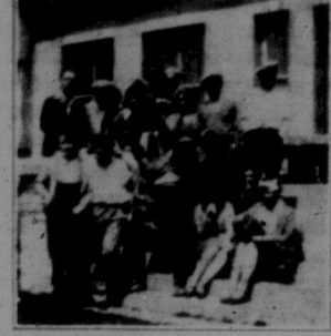
Коло будинку приюту.

я назад і бачу, що наш гурт розбився: Одні лишилися позади на один блок, другі на пів блоку. Ті, що йшли на самому заді, співають "Пряпур червоний".