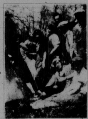
Група учасників походу на фармі над рікою.

Прибігаю на місце, вже і тов. Адаме виїшов з якогось кудлатого собакою, що біжить за мною і гавкає. Я тоді простягнувся і віддихав. Тов. Адаме покликав мене помігти йому устанити столи, де ми маємо їсти. Зробивши це, я вмився і очінував на рещту. Аж за якусь годину бачу, вже йдуть наші спотикаючись, бо дорога таки далека, та це у таку спеку.