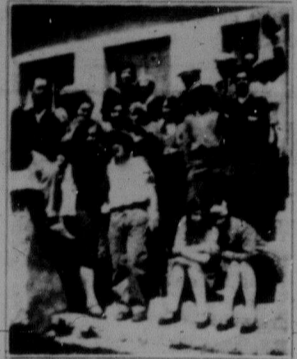
Група учасників походу на фарму прибуту Р.З.Т. 24. травня. Учасники мандрівки перед будинком приюту.