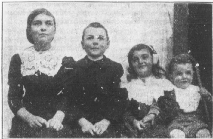
HEUREUX PETITS COMMUNIANTS.

Il est nécessaire «que l'enfant comprenne, selon sa capacité les mystères de la foi nécessaires de nécessité de moyen» . c'est-à-dire ces vérités que tout homme est absolument tenu de connaître s'il veut faire son salut éternel.