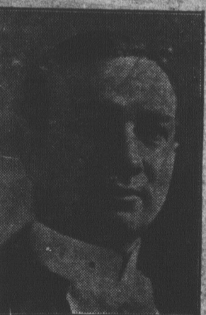
HON. JACOB NICOL Trésorier de la province de Québec, qui a montré les plus hauts revenus dans l'histoire de sa province avec un surplus de $1,804,854. Un million servira à réduire la dette.