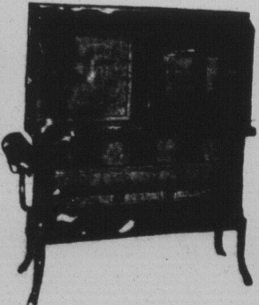
Poêle à l'huile automatique McAlary

Grand Assortiment d'Appareils Electriques modernes. Vous êtes cordialement invités à visiter nos accessoires Electriques etc.: nos prix sont les plus bas. Grille pain Electrique $4.50 à 6.50 Fer à repasser Electrique $4.00 et 5.50 Evantails Electriques de $12.50 et plus. Poêle de cuisine Electrique, Vibrateurs à message Electrique. Aussi nous avons un très bel assortiment de glacières nouveaux modèles. Assortiment complet de poêles à l'huile de deux, trois, et quatre feux. Boyaux pour arrosage en caoutchouc cordé de première qualité 1/2 pc. 18c. par pied 1/2 pc. 20c. par pied.