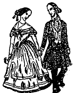
CLEOPHAS ET SCHOLASTIQUE.

me porte-paquet dans quelques magasins de marchandises sèches ou dans une grocerie.