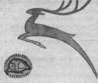
Megismétlődött a gödöllői cserkész-tábor óriási arénájában az a csodálatraméltó jelenet, amely a megnyitás napján lenyűgözte a szemlélő nagyközönséget.

BADEN-POWELL, A CSERKÉSZMOZGALOM ALAPÍTÓJA, A GÖDÖLLŐI VILÁGTÁBOR MINDEN KÜLFÖLDI RÉSZTVEVŐJÉVEL MEGIGÉRTETTE, HOGY HANGADÓI LESZNEK SAJÁT HAZÁJUKBAN MAGYAR NÉP IRANTI SZERETETÜNKNEK