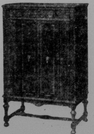
НОВЕ РАДІО-ФОНОГРАФ фірми Роджерс (комбінеїшин) є одним з найкращих на ринку. Радио має 8 ламп; шільний кабінет зроблений з орехового дерева та англійського дуба. Радио і фонограф оперує електрикою. Голосомовець має 11-цалеву трубу. Цей прекрасний мебель даємо даром для того товариша, що буде другим найвищим збирачем передплати на "Українські Робітничі Вісті". Радио-фонограф коштує $395. Радио куплено в фірмі J. H. McLEAN CO. 329 PORTAGE AVE. WINNIPEG

І автомобіль і кожну іншу нагороду можна дістати тільки за гроші прислані на передплату, але гроші одержані від особи, яка хоче газети.