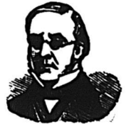
MARQUE DE COMMERCE