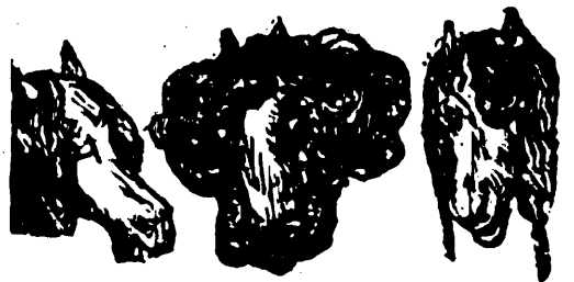
CHEVAUX DE FRISES.