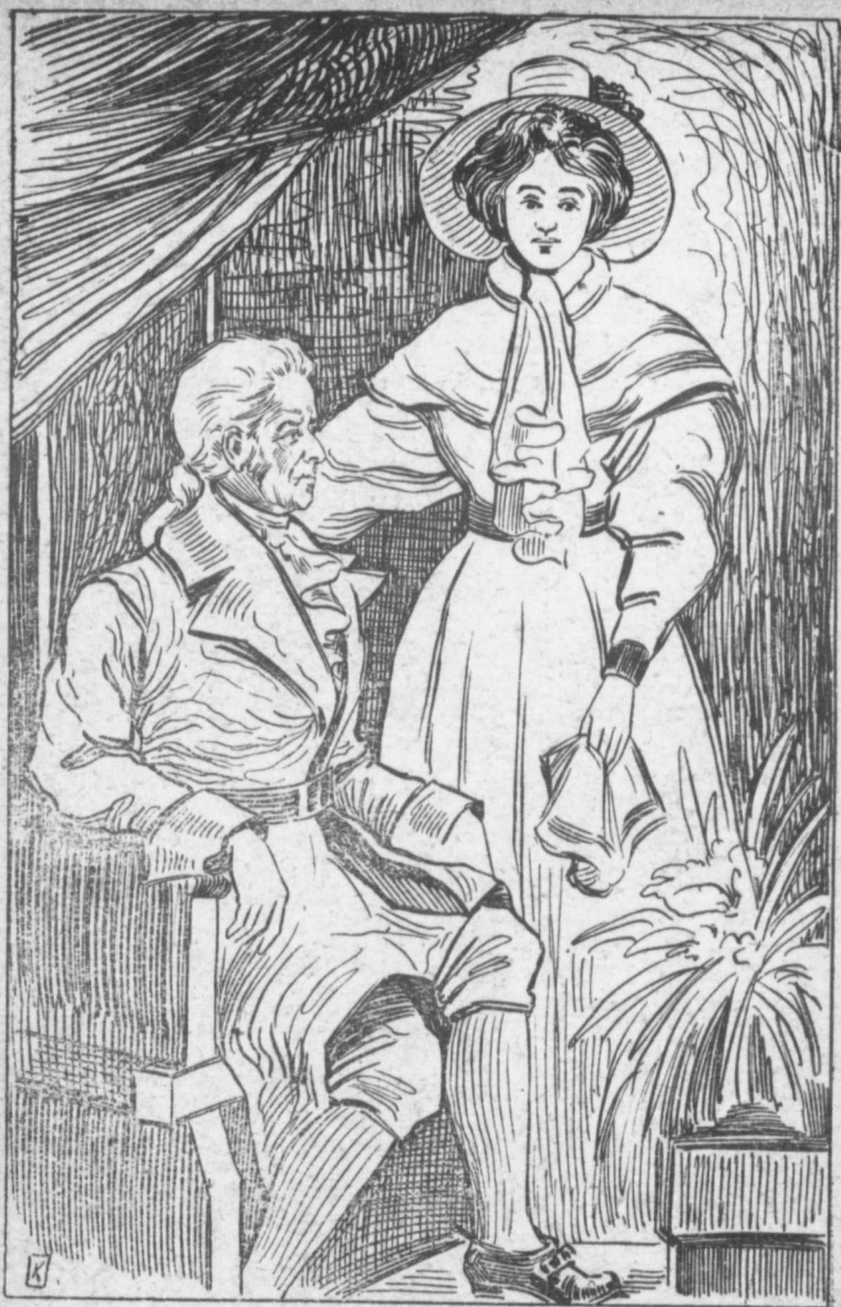
René Bolduc et sa jeune fille