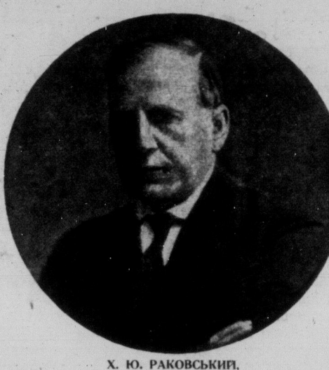
Х. Ю. РАКОВСЬКИЙ, будучий радянський амбасадор до Великої Британії.