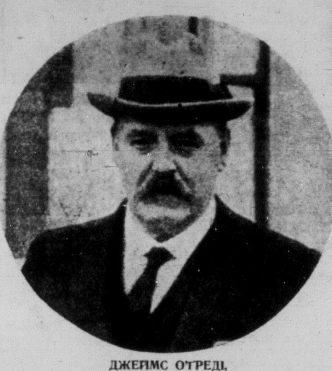
ДЖЕЙМС О'ГРЕДІ, будучий британський амбасадор до Рад. Республік.

МОСКВА, 4. лютого. — Росія надіється визнання ще цього місяця від Італії, Норвегії, Бельгії, а можливо і Франції. Радянська влада вірить, що тепер, коли робітничі правительства Великої Британії проломлює лід, ноти з визнанням наспіють скоро з других держав.