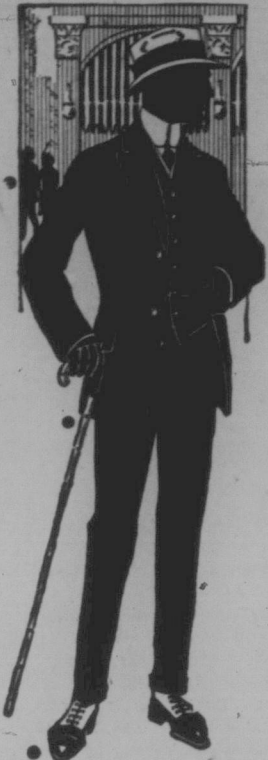
Society Brand Clothes

Ein Paar $6.00 Schuhe FREI mit diesem Anzug.