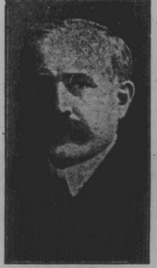
J. A. Calder, Minister für Einwanderung und Kolonisation in der neuen Koalitionsregierung.

Liberaler Vertreter in der nationalen Einheitsregierung: W. B. Rowell, Präsident des Kabinetts, J. A. Calder, Minister für Einwanderung und Kolonisation, Arthur L. Eifion, Minister für das Goldfeld, L. A. Greer, Landwirtschaftsminister. (Fortsetzung auf Seite 4.)