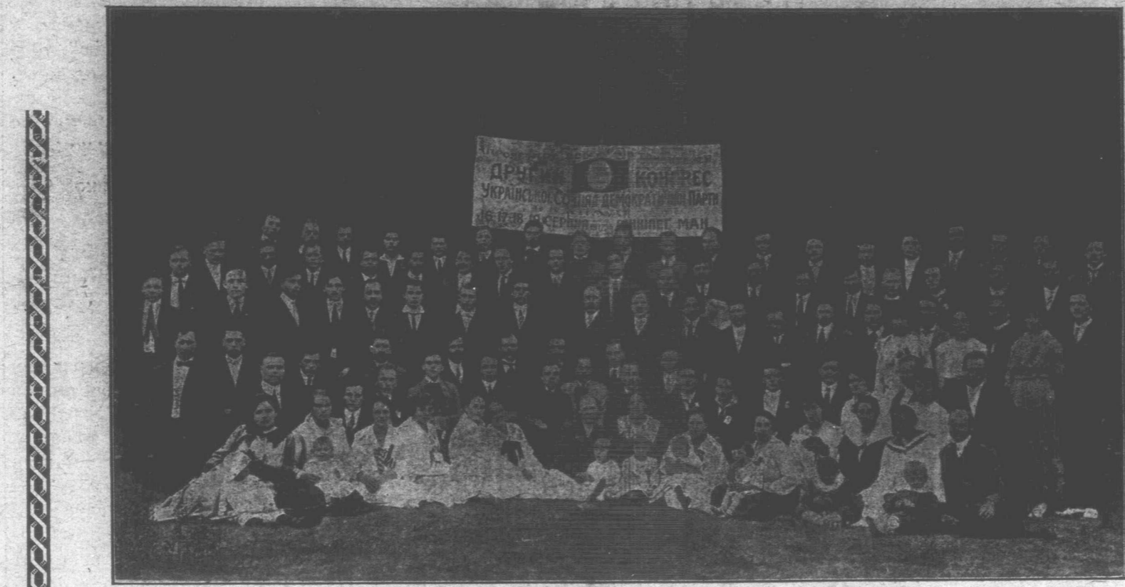
Члени Відділу У.С.Д.П. і Драм. Кружка ім. В. Винниченка в Вінніпегу і делегати на-другий з'їзд У.С.Д.П. відфотографовані на пікніку устроєнім з нагоди з'їзду.

Вашінгтон, 4 вересня. — Одержано ту офіційальне подтверджене, що Росіяни опустили Ригу, заатаковану Німцями з трох сторін, з суші і з моря, і дофаяють ся на північний схід.