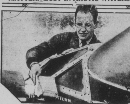
James Mattern, round-the-world flier, has been lost for several days, it is thought, on the little island of Erikoff in the Bering Sea, where he was forced down on his hip from Siberia to Nome, Alaska. The above photo, one of the last taken on his round-the-world tour, shows him getting ready to leave Oslo, Norway, for Moscow, Russia.