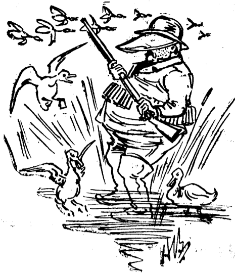
Black Joe chassant dans les îles de Sorel.

La chasse, dit un chroniqueur du moyen-âge, sert à fuir tous péchés mortels ; bon veneur a en ce monde joie, liesse et déduit, et après aura paradis encore.