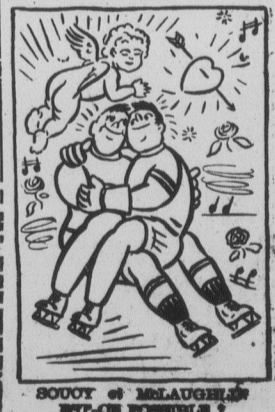
BOUYOT et MCLAUGHLIN EST-ON FORMIDABLE ?