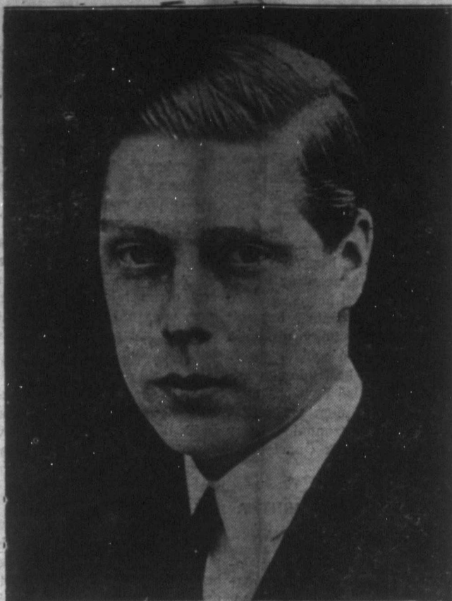
Walesi herceg, az angol trón várományosának 35. ik születésnapját az egész angol birodalomban nagy fényűző ünnepelték meg.

Reméljük, hogy súlyosan beteg hozzátartozóink minél hamarabb fel fog épülni.