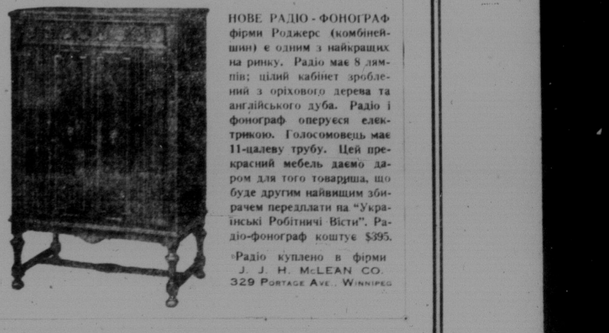
НОВЕ РАДІО-ФОНОГРАФ фірми Роджерс (комбінаційний) є одним з найкращих на ринку. Радіо має 8 ламп; цільний кабінет зроблений з орехового дерева та англійського дуба. Радіо-фонограф оперується електрикою. Голосомовець має 11-цалеву трубу. Цей прекрасний мебел' дає даром для того товариша, що буде другим найвищим збирачем передплат на "Українські Робітничі Вісті". Радіо-фонограф коштує $395.

Нас повідомляють, що в деяких місцевостях збірка нових і старих передплат іде досить успішно. З інших знову пишуть, що зразу багатьох товаришів зацікавила справа придбання нашої газети нових передплат, але по кількох днях праці зобачивши, що хтось один з них придбав кілька передплат більше і стоїть покищо найвище, вони думають, що їм не пощастить добитися нагороди. Цим не треба зражуватися.