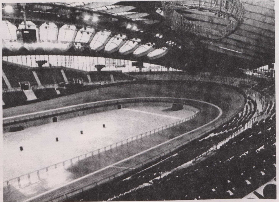
El Velódromo (arriba), construido para los Juegos Olímpicos de Verano de Montreal 1976, será el lugar de la mayor exposición floral de América del Norte.

En el exterior, la exposición incluirá un despliegue de flores, árboles y arbustos ornamentales, coníferas, especies de hoja perenne, macizos de rosas, árboles frutales, verduras, jardines hortícolas, cantos de flores, exhibiciones educativas y científicas y jardines infantiles y comunales. Con objeto de apreciar completamente las exhibiciones durante los varios períodos de florecimiento se necesitarán,