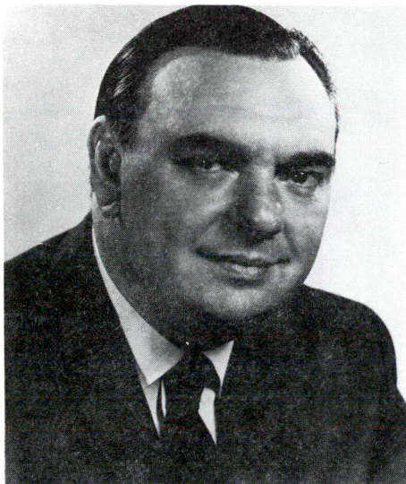
Donald C. Jamieson, früherer Handelsminister und jetzt kanadischer Außenminister.

Weitere Broschüren, Informationsblätter usw. über Kanada sind bei folgenden kanadischen Auslandsvertretungen erhältlich: