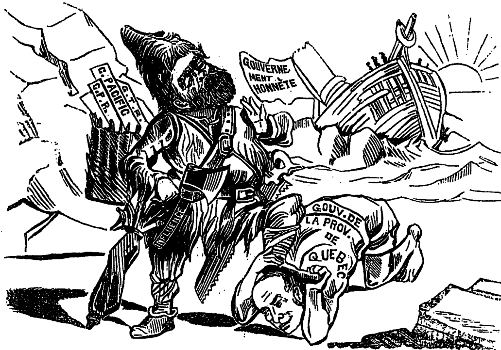
LE "VENDREDI" DU GRAND ROBINSON CANADIEN

Des yeux qui s'appellent. — Un Marseillais cause de sa moitié avec un ami : — Ah ! mon bon, Elmire a des yeux, rien qu'en regardant un miroir elle fait fondre la glace !