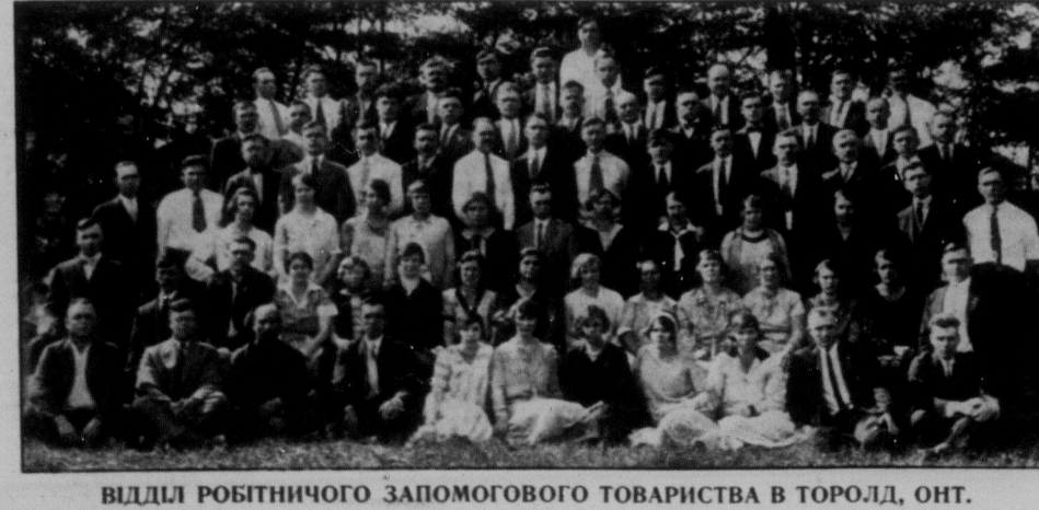
ВІДІЛІ РОБІТНИЧОГО ЗАПОМОГОВОГО ТОВАРИСТВА В ТОРОЛД, ОНТ.

В НЕДІЛЮ, 30. ЖОВТНЯ по полудні відбудуться товаришескі збори, а вечером концерт, в якому знову візьмуть участь місцеві й позамісцеві сини. Будують для оглядин буде відкритий в суботу, 19. жовтня в год. 6. вечером. Всіх робітників і робітниць, як місцевих, так і позамісцевих щиро вітаємо. Будівельний Комітет.