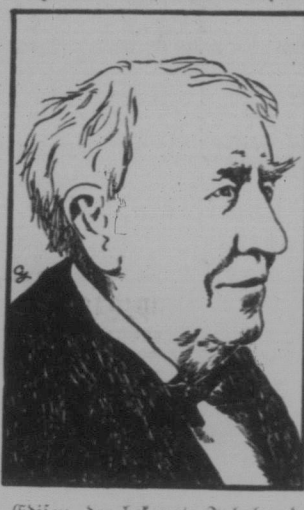
Edison, der bekannte Erfinder der größten Erfindergemeinschaft der Welt, begann seine Laufbahn als Zeitungsjunge. Seitdem ist er stets vielbeschäftigt gewesen. Nach einer An-

dote wurde er eines Tages von einer jungen Frau befaßt, die ihn persönlich kennen lernen wollte, weil sie sich für seine Leistungen interessiert hatte. „Welchem Umstände schreiben Sie Ihren Erfolg zu?“, fragte die Dame. „Nur der Arbeit, gnädige Frau“, sagte Edison, „harter Arbeit und dem Durchhalten.“ „Aber, mein Herr, Sie sind ein Genie“, erwiderte sie, „das hat sicherlich etwas damit zu tun.“ Die Antwort des großen Mannes war typisch. Langsam antwortete er: „Nicht, vielmehr. Aber ich habe Sie, meine besondere Art von Genie ist ein Prozent Inspiration und 99 Prozent Perseveration.“