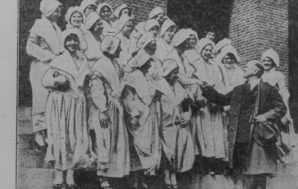
Diese französisch-Canadierinnen von den Territorien Canadas folgen den Spuren ihrer Ahnen, die verbannt worden und nach dem amerikanischen Südstaaten Louisiana gewandert sind. Hierer Bild zeigt die Damen beim Besuche des Staatsschauspiels in Vojan.