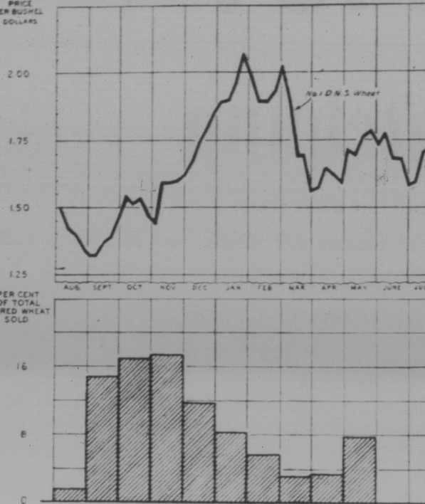
Fig. 1. Farmers who stored wheat gained in 1924-25 because prices were generally rising during the months of heavy sales of stored grain.

unter des Getreides die Verion, welche darüber entscheiden soll, an welchen Terminalelevator ihr Getreide verkauft werden soll. Nun bezieht man, daß Nicht Turgeon bei der Vorbereitung dieser Abänderung des canadischen Getreidegesetzes mit der Behörde der Getreidekommission nicht verhandelt hatte. Aufeinander hatte er dabei seitens dieser Behörde keinen Widerspruch erfahren. Folglich kann man mit Recht sagen, daß die Turgeon-Kommission und die Behörde der Getreidekommission sich im Jahre 1925 darauf einig waren, daß es dem Farmer gestattet werden sollte, sein Getreide an irgendeinen Terminalelevator zu verkaufen, den er sich auswahlen würde.