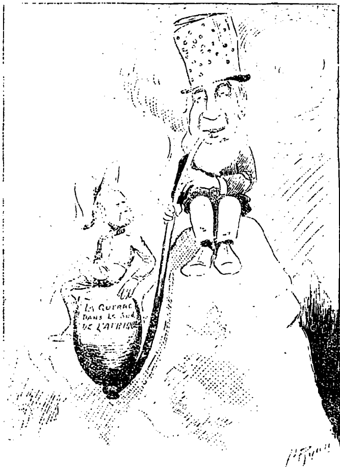
KRUGER. — Ecoute, mon p'tit Roberts, tu peux t'y assoir aussi longtemps que tu voudras, mais jamais tu ne m'empêcheras de fumer. Ton chien est mort pour ça.