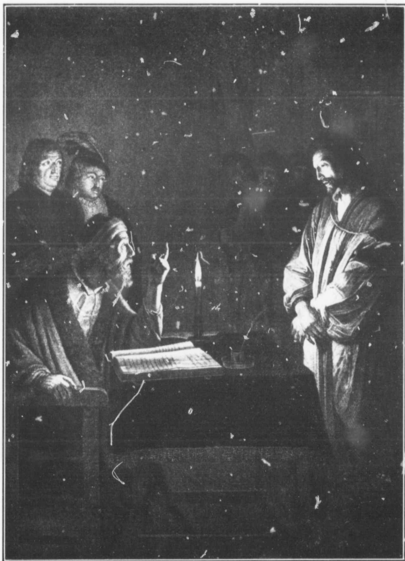
JESUS-CHRIST DEVANT ANNE.