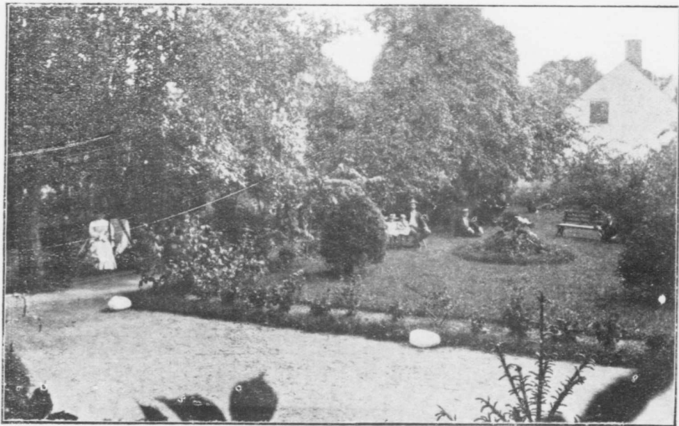
SANATORIUM, TROIS-RIVIÈRES, P. Q.—LES JARDINS.