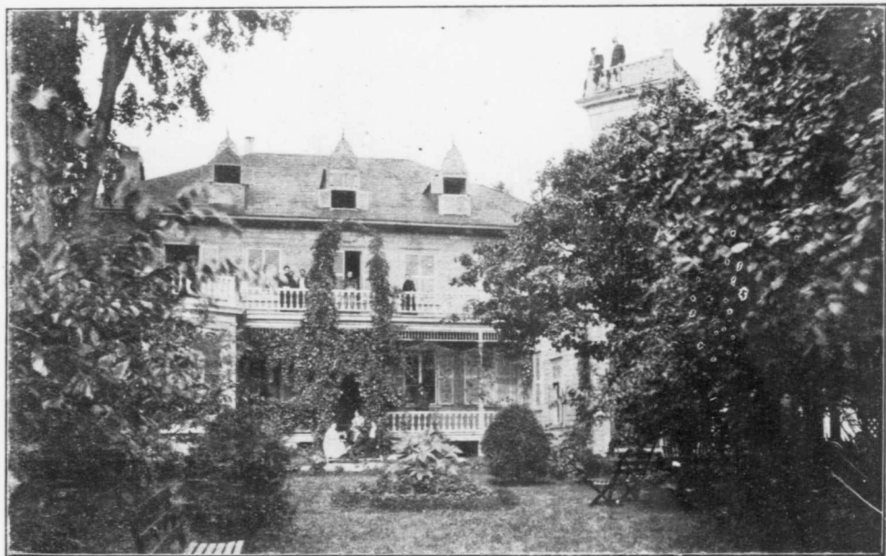
SANATORIUM, TROIS-RIVIÈRES, P. Q.—CORPS PRINCIPAL, PARTIE OUEST.