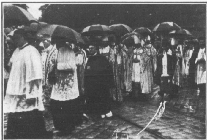
Défilé des Evêques

"Puisque la pluie ne m'empêche pas d'aller à la chasse pourquoi m'empêcherait-elle d'aller à la procession? Malgré les intempéries, Dieu sera adoré sous la voûte du ciel par mon peuple et devant mon peuple par les peuples de l'univers catholique," avait dit la veille l'empereur.