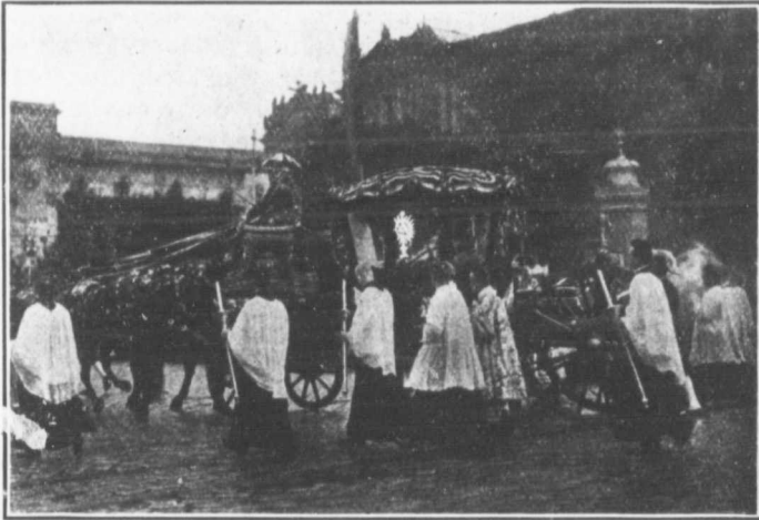
—> Le carrosse portant le Très Saint Sacrement. <—

Ce qui domina ce Congrès, comme les précédents, ce fut cette grande procession de dimanche où un demi-mil-