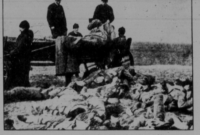
Після бою на німецько-російському фронті селяни збирають жовнірські трупи, щоб їх спільно прикрити в глибокій рові.