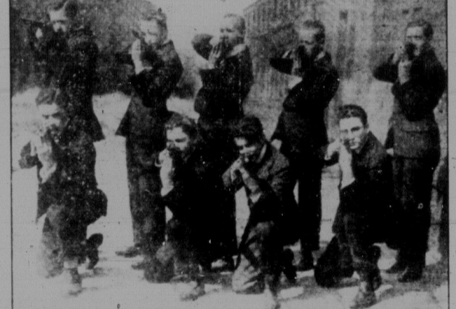
Після минулої імперіалістичної війни в школах Нью-Йорку заведено науку стріляння. В той час як представники правлять різних держав підписують всілякі мирні договори і говорять про роззброєння, в школах навчають молоді військового ремесла.