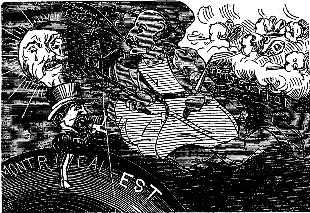
UN BEAU SOLEIL OBSCURCI PAR LES NUAGES.

Cependant on n'avait sous la main personne qui put opérer la multiplication des turbots saucé capre et des petits pains officiels. Il fallut que l'ad-